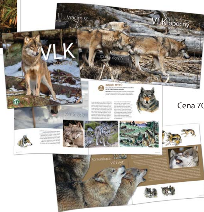
Cena 70,- Kč

Do výběhu vlků můžete vyrazit se svými žáky také bez doprovodu našich lektorů. Základní informace o vlkovi či rysovi se dozvíte v brožurách, které jsou doprovázeny množstvím jedinečných fotografií a ilustrací. Brožury můžete zakoupit ve všech informačních střediscích a návštěvních centrech a e-shopu Správy.