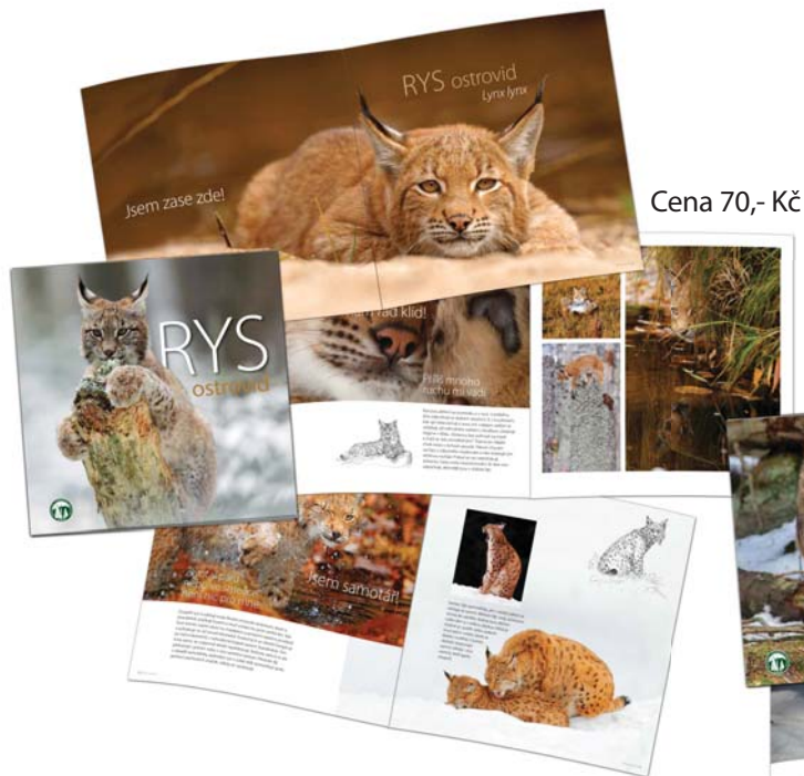
Cena 70,- Kč

Do výběhu vlků můžete vyrazit se svými žáky také bez doprovodu našich lektorů. Základní informace o vlkovi či rysovi se dozvíte v brožurách, které jsou doprovázeny množstvím jedinečných fotografií a ilustrací. Brožury můžete zakoupit ve všech informačních střediscích a návštěvních centrech a e-shopu Správy.