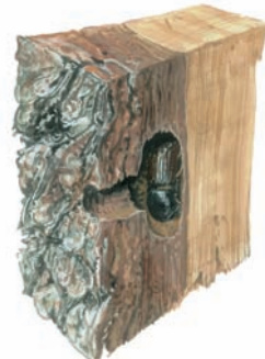
Tvorba snubní komůrky - tzn. sameček tvoří komůrku v lýku - pod kůrou.