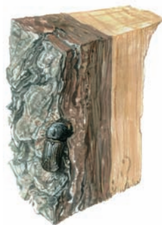
Sameček zakládá požerok - tzn. sameček se zavrtává do kůry.