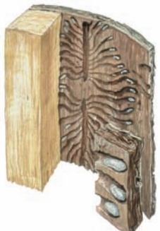
Vylíhlé larvy spirálovitě hlodají larvové chodby kolmo na chodby matečné.