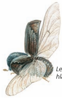
Letící hladový kůrovec.