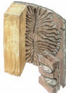
Na konci larvové chodbičky je taková „mistička“ - kukelná kolébka - larva doroste zhruba 5,5 mm.