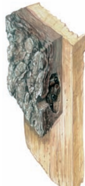
Tvorba snubní komůrky - tzn. sameček tvoří komůrku v lýku - pod kůrou.