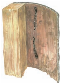
Tvorba matečné chodby - každá samička tvoří jednu chodbičku - jedna nahoru, druhá dolů, po kraji chodbiček kladou vajíčka - cca 60 vajíček - kladou po 1 vajíčku na jedno místo - za sebou milimetrový interval.