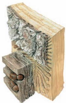
V kukelné kolébce se z larvy vyvine světle hnědý nepohlavně dospělý brok. Poté kůrovec tmavne a vykoušává se ven.