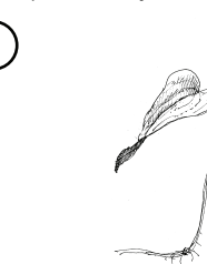
D/ pstroček dvoulistý