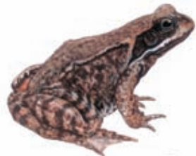
1 Skokan hnědý