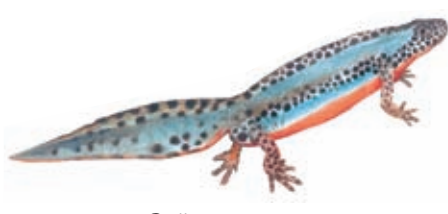
2 Čolek horský