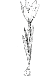
C/ šafrán bělokvětý