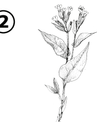
D/ plíčník lékařský