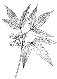
A/ kyčelnice devítilistá

V dalším úkolu vyberte vždy jednu rostlinu, která se nehodí do této čtveřice, a řekněte proč!