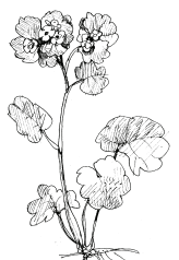
C/ mokryš střídalostý