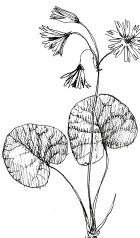
C/ dřípátka horská