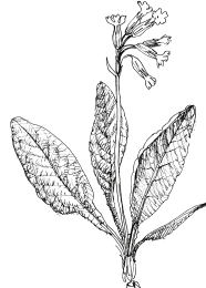
B/ prvosenka jarní