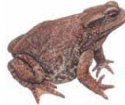
3 Ropucha obecná

V dalším úkolu vyberte vždy jednu rostlinu, která se nehodí do této čtveřice, a řekněte proč!