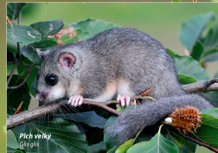
Plch velký Glis glis