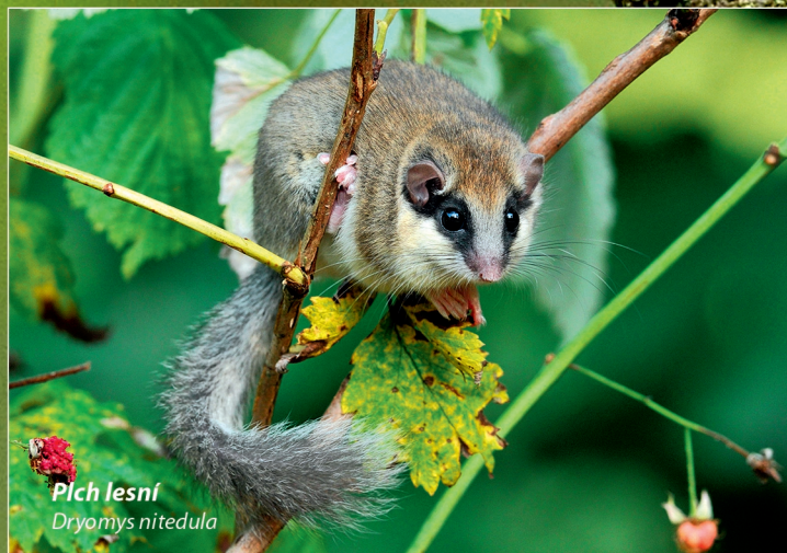
Plch lesní Dryomys nitedula