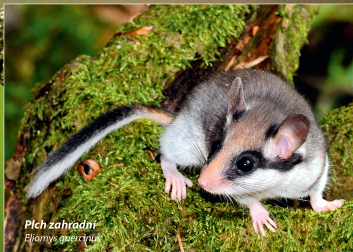
Plch zahradní Elomys quercinus