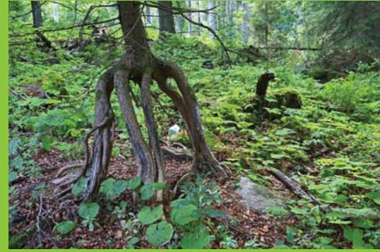
Prales na Medvědicí s chůdovými kořeny stromů, které vyrostly na mrtvém dřevě.