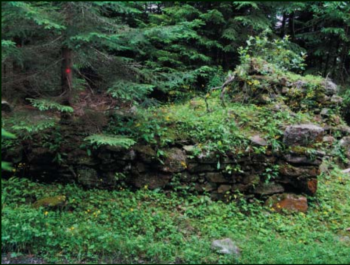
Velká kaple – před započítím prací