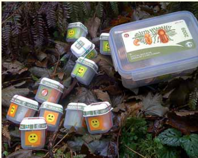
Jak je nevidíte aneb systém schránek „Lýkožrout smrkový 2009“ před umístěním v terénu

Účastnit se může v podstatě kdokoli, schopný orientace v terénu a vybavený objevitelskou chutí. Geocaching provozují i celé rodiny, takže na jedné straně se účastní děti od útlého věku a na straně druhé babičky a dědečkové, které nebaví sedět doma a rádi objevují nové a nepoznané. Některé krabičky jsou přes den navštíveny až desítkami lidí, jiné čekají na své objevitele i celé týdny či měsíce.