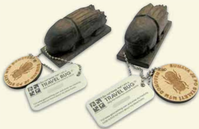
Dřevěni brouci Koorovec 001 a Koorovec 002 před vypuštěním do volné geopřírody

Multicache „ V ráji šumavském “ byla zpřístupněna počátkem června 2010 a upomíná na situaci po ničivé vichřici z 21. října 1870, jak ji zachytil Karel Klostermann ve své stejnojmenné knize. Přímo v terénu lze spatřit jak rychle se krajina dokáže zotavit a přitom bezděčně vzpomenout na dobu, kdy Šumavě vládl „zlatý brouček“ a kdy byly položeny základy pozdější smrkové monokultury.