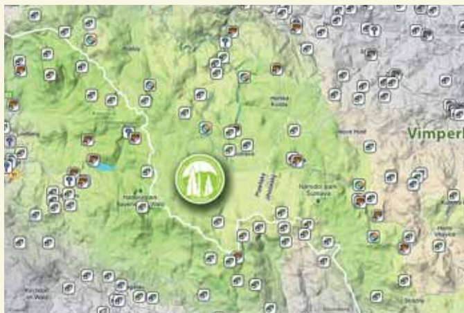
Schránky na území NP a CHKO Šumava a okolí (mapový podklad Google maps)