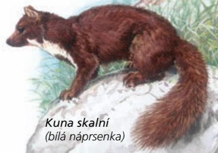
Kuna skalní (bílá náprsenka)