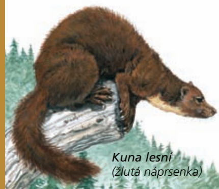
Kuna lesní (žlutá náprsenka)

Za potravou se vydávám za tmy a pochutnávám si hlavně na hraboších, veverkách, hmyzu a lesních plodech.